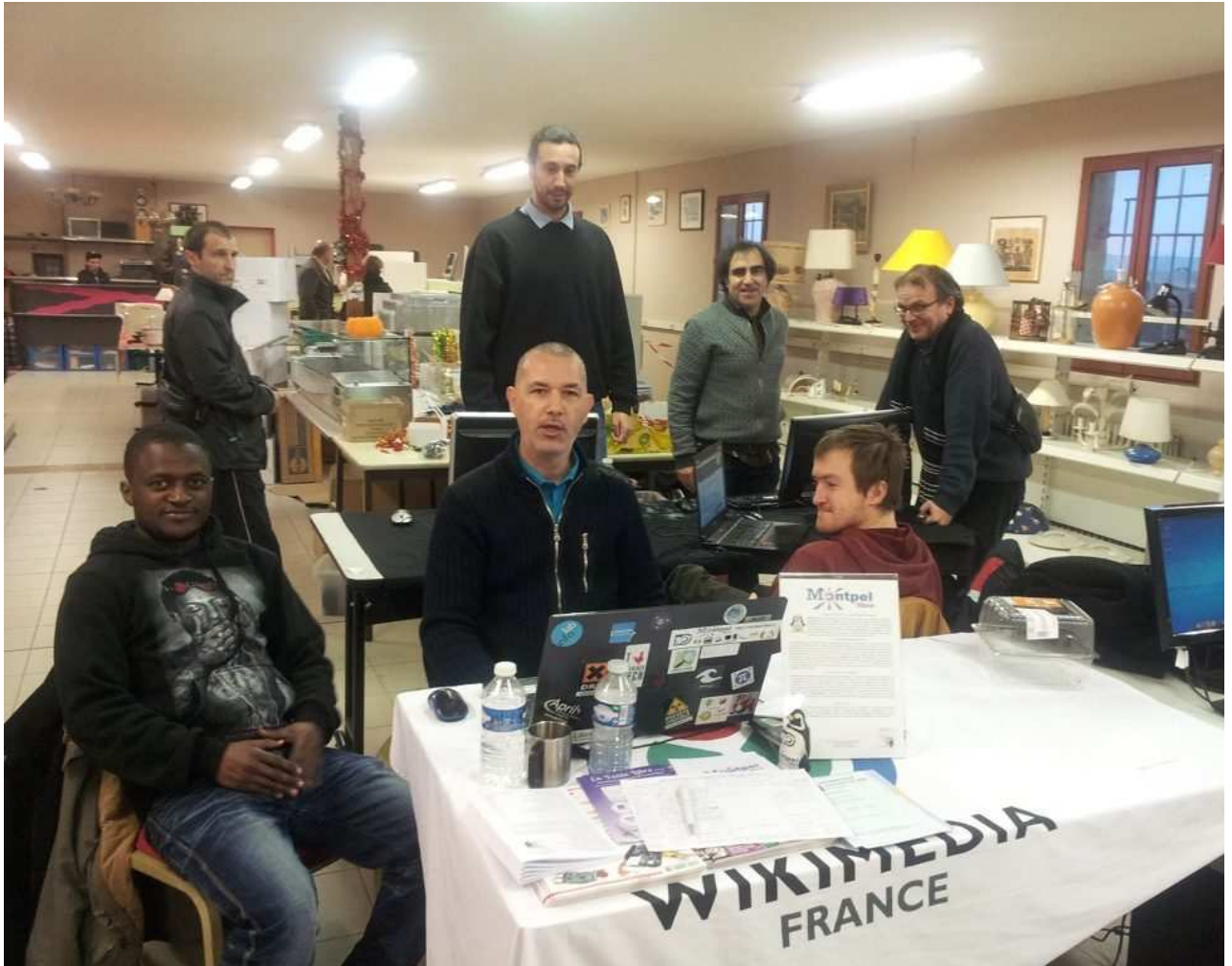
Montpel'libre présente les logiciels libres à la communauté Emmaüs de Montpellier (décembre 2015)